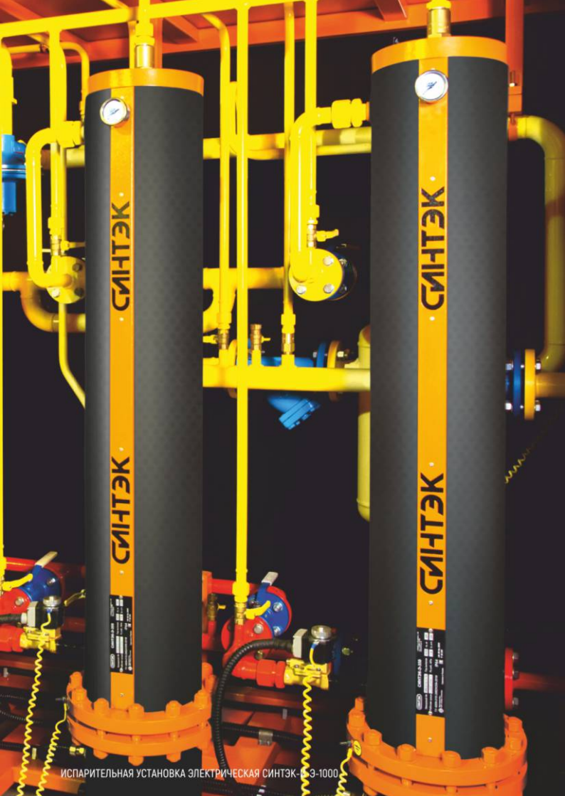
ИСПАРИТЕЛЬНАЯ УСТАНОВКА ЭЛЕКТРИЧЕСКАЯ СИНТЭК-Э-1000